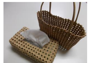
完成した作品たち☆

以前からやりたかったことなので、初めて作品が完成した時は達成感と満足感がありました。私は何事も途中で投げ出すのは嫌いで、どんな形であれ最後までやり遂げるようにしています。エコクラフトも、ゆうがおに来なければ出来なかったことかも知れませんね。ゆうがおの皆さんにも、是非自分が好きな事に挑戦してもらいたいと思います。あえて自分から環境を変えてみることも重要かも知れませんよ。