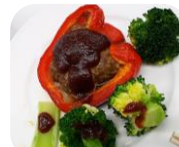
彩りよくて見た目よし♡味もよし♡