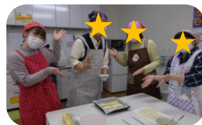
アップルパイ作りは型なしで手軽に♪

「春を先取りメニュー」をテーマに調理実習を行いました！ 献立はパプリカの肉詰め、菜の花のおひたし、ニラ玉汁、アップルパイでした。 少しずつ調理の腕を上げている方もいます！ やっぱり皆で作ると格別に美味しいですね！！