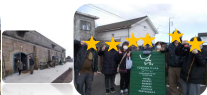
吉田村ヴィレッジにはお酒落な パン屋さんや花屋さんがあり☑