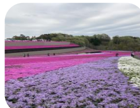
気が付いたら夢中で記念撮影していました♪(笑)

今年度初の外出行事は市貝町の芝ざくら公園に行きました！！ 天気が心配でしたが散策中は傘を使うことなく、ゆったり見て回ることができました♪ 新聞やメディアに多く取り上げられていた通り芝ざくらが一面に広がる風景に皆うっとり！！