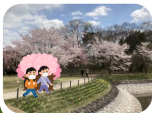
桜が満開！花見を満喫！！

小山市の大沼でお花見ピクニックをしました！ 満開の桜を眺めながらのお弁当は最高でした！ 下野市のオシャレスポット…しもつけ道の駅や 吉田村 village (ヴィレッジ) を堪能しました♪